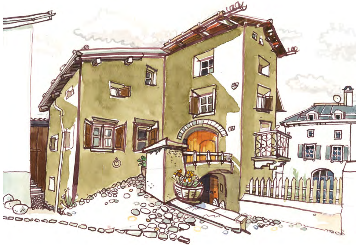
ZUOZ DOPPELSTOCK BY ANDRÉ SANDMANN