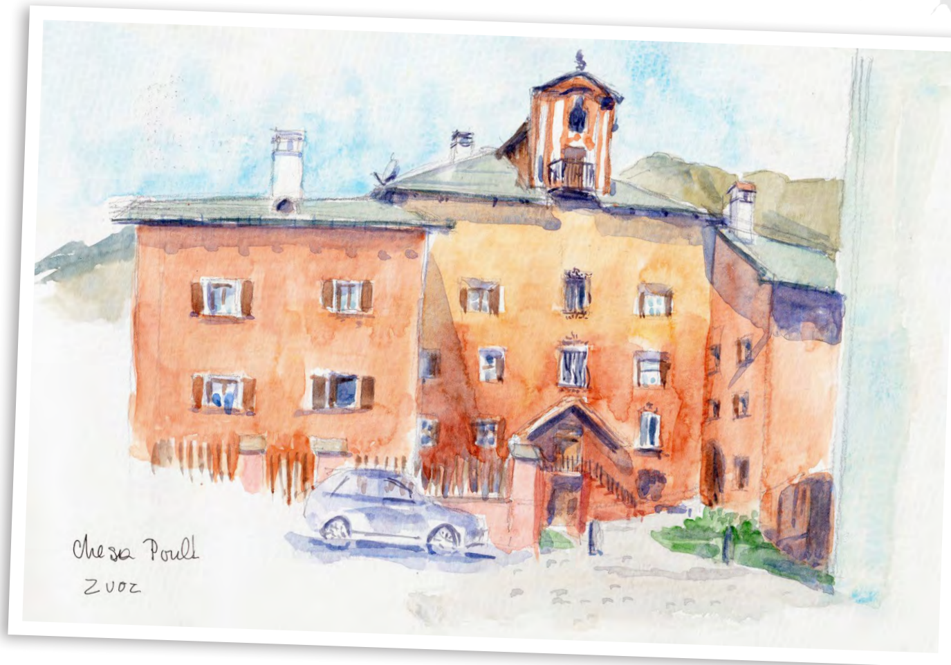
CHESA POULT BY KRISTYNA DISLICH