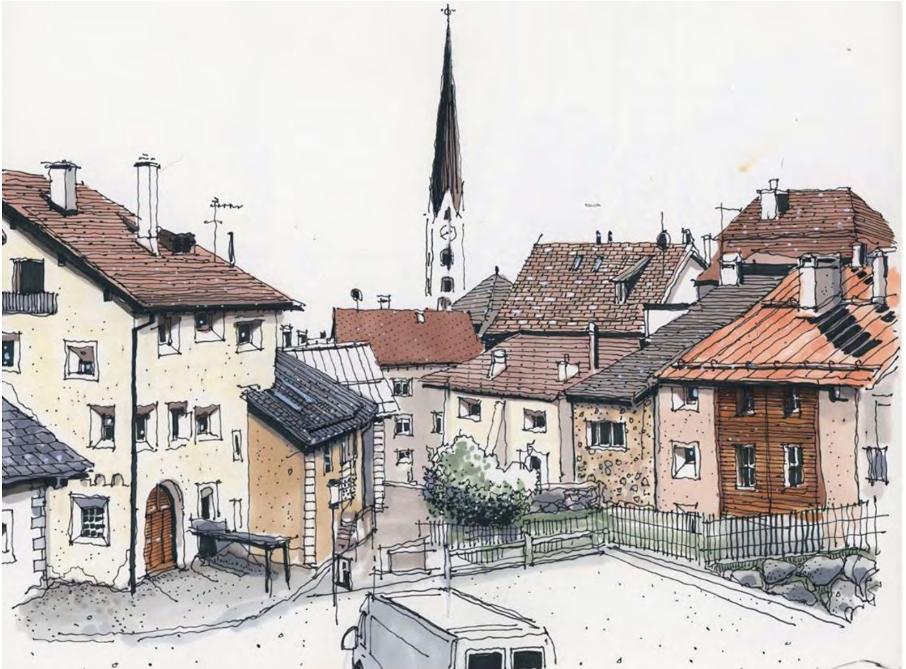
ZUOZ SKETCH BY PHIL DEAN